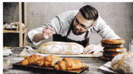
Produsele de patiserie sunt preferate de mulți consumatori.